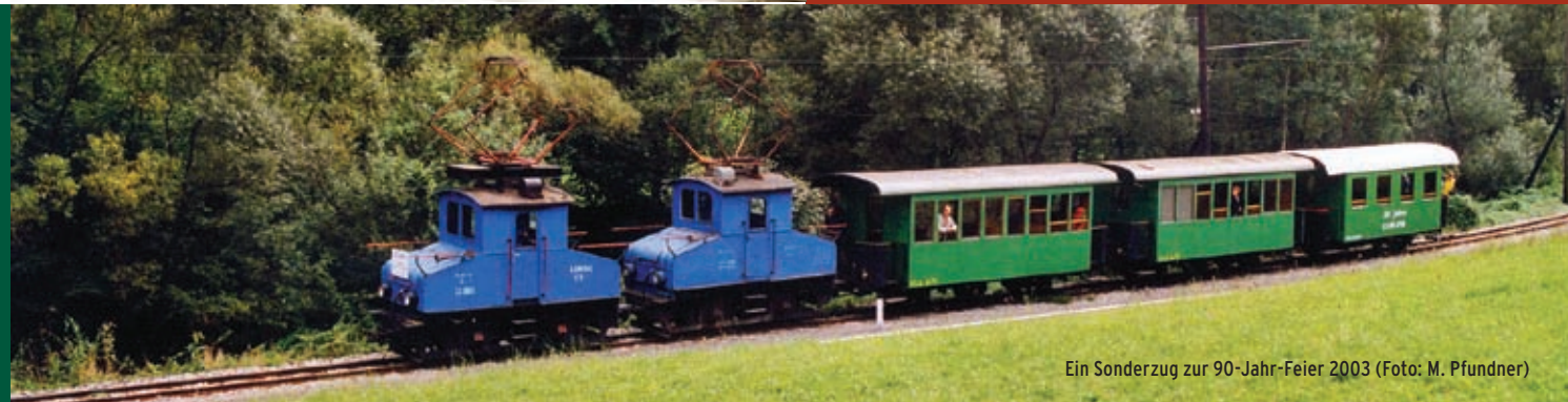
Ein Sonderzug zur 90-Jahr-Feier 2003