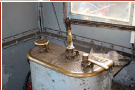
Der einfache Führerstand der Nostalgielokomotive E 2 Unsere Garnitur bei Verschubarbeiten im RHI-Werk in der Breitenau