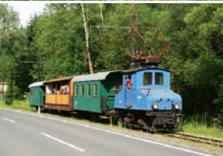
Unser beliebter Aussichtswagen bei einer Sonderfahrt im Bereich Mautstatt