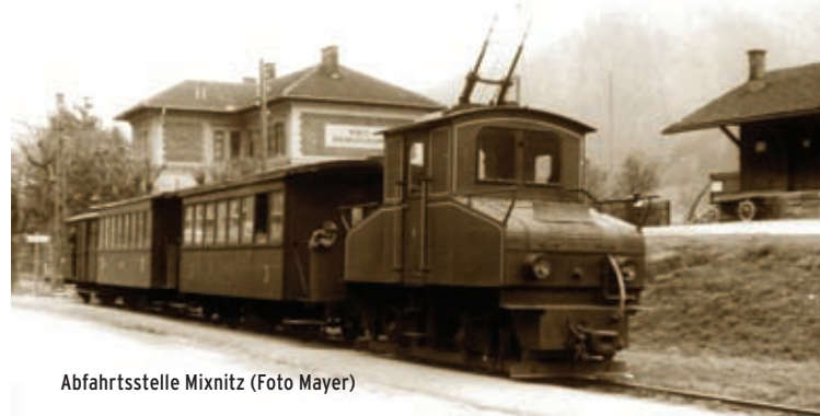
Abfahrtsstelle Mixnitz