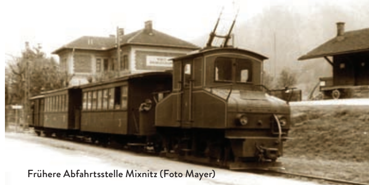
Frühere Abfahrtsstelle Mixnitz

Gasthof Hofbauer Breitenauer Straße 37 8614 Breitenau Tel. 03866 - 2262 www.gasthof-hofbauer.at