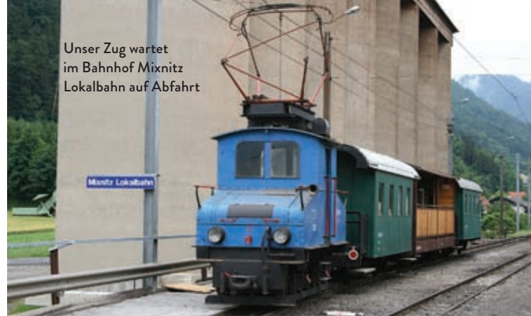
Unser Zug wartet im Bahnhof Mixnitz Lokalbahn auf Abfahrt

Ihr Ansprechpartner für Sonderfahrten: Verein Freunde der Breitenauerbahn, Tel. +43 - 676 - 53 13 725, www.breitenauerbahn.at